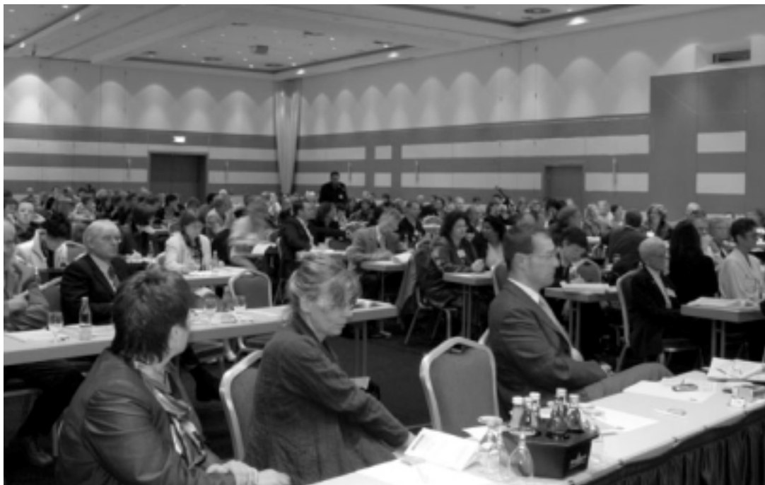
Gespannte Aufmerksamkeit – Blick in den Saal bei der Abschluss-tagung

Andernfalls bleibe es bei der Zuständigkeit der Länder. Nach Auskunft des BMFSFJ lässt das vorhandene Datenmaterial den geforderten Nachweis gegenwärtig nicht zu. Alternativen zu einer gesetzlichen Regelung seien aber weiter im Gespräch.