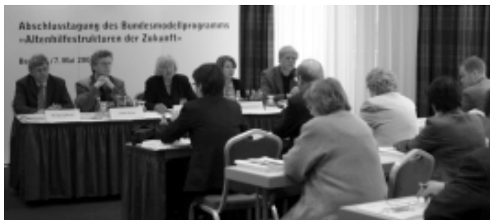
Reges Medieninteresse während der Pressekonferenz