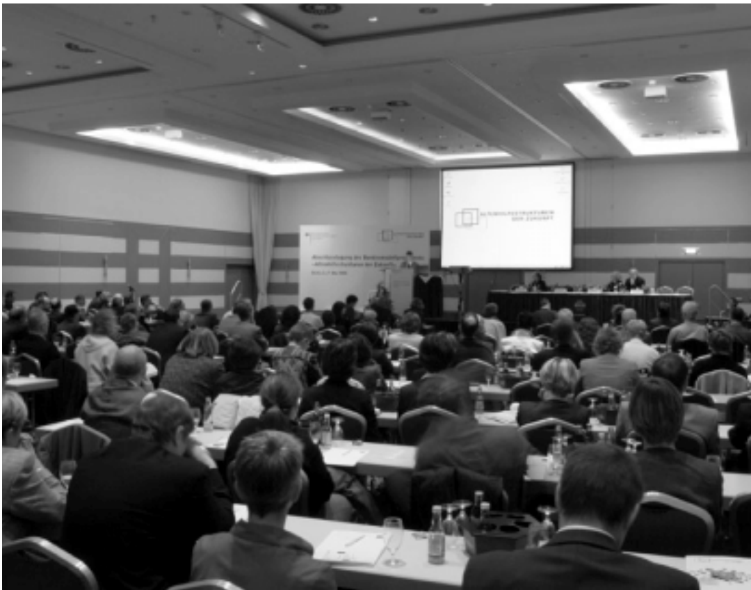
Abschlussstagung war Treffpunkt für Fachöffentlichkeit